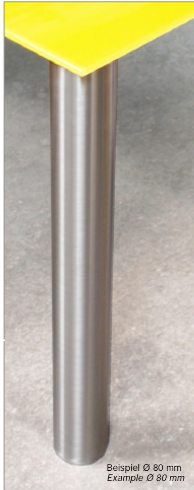
Beispiel Ø 80 mm Example Ø 80 mm

Table legs complete set Ø 50 and Ø 80 mm